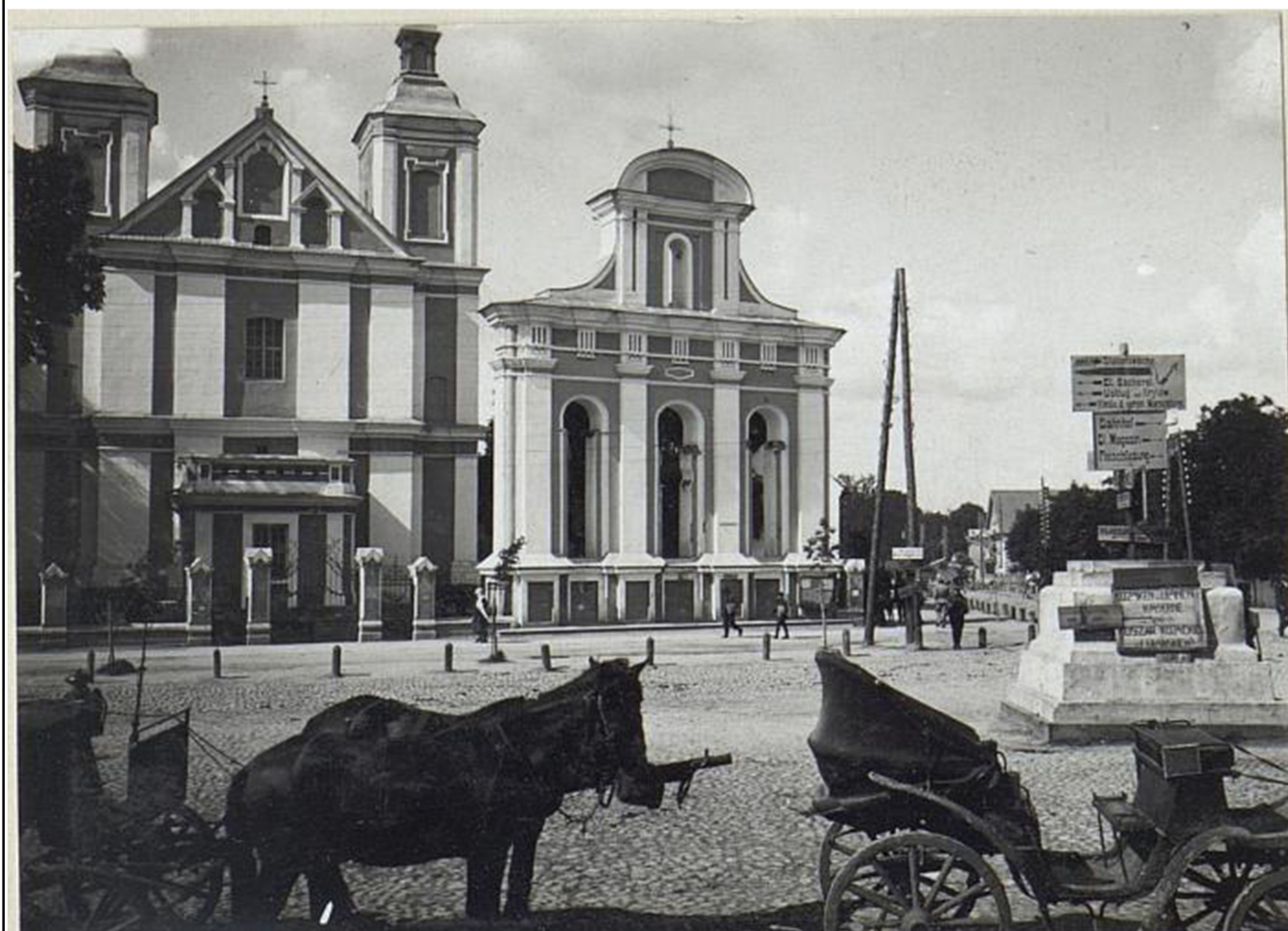
6. Костел Іоакима і Анни. Вигляд з південного боку ( теп.Площа Героїв)