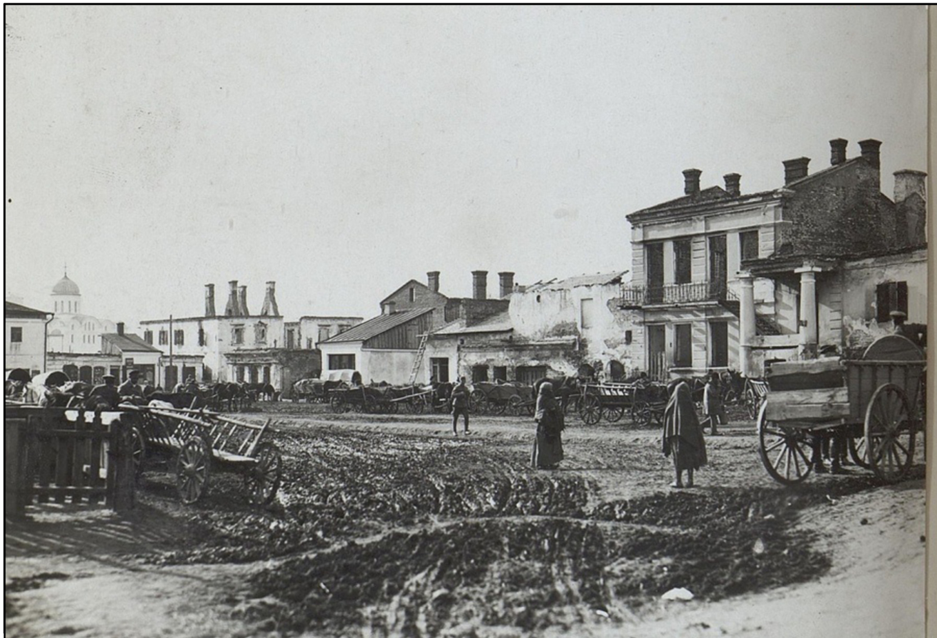
9.Ринкова площа 1918 р.