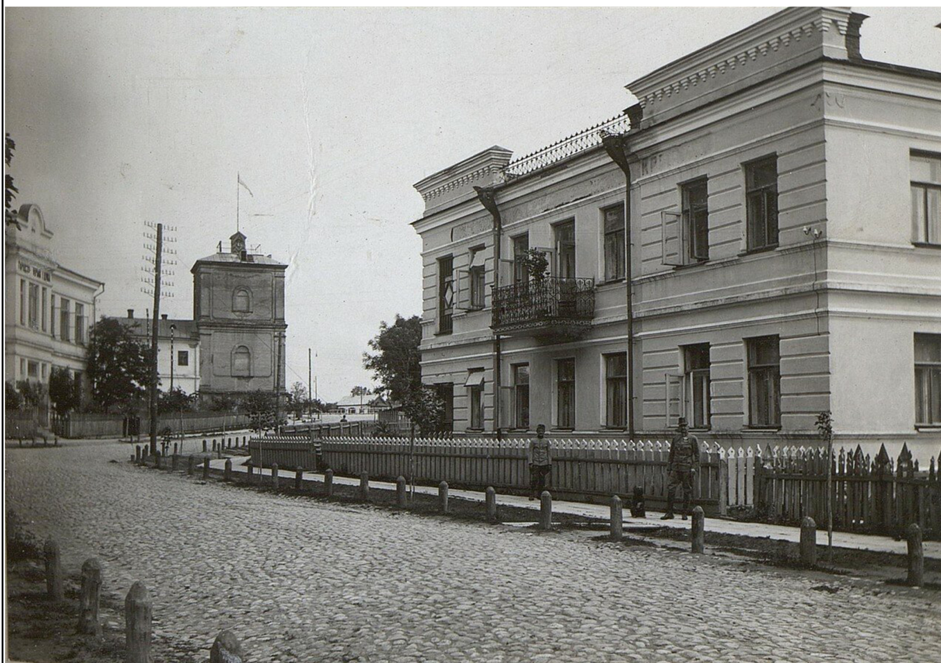
8. Вигляд на Домініканський монастир, 1917-1918 рр.