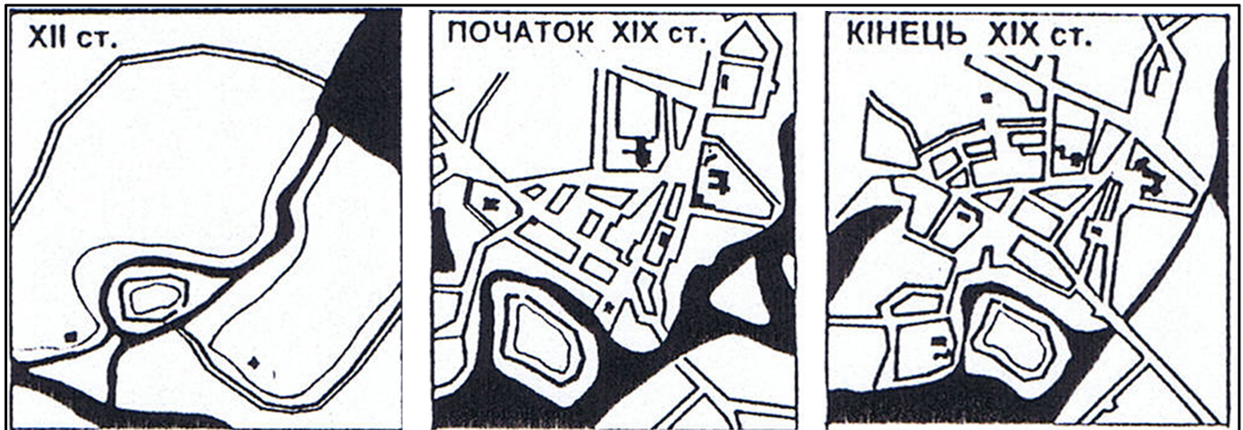
1. Етапи розвитку планування та історичного формування забудови м.Володимира-Волинського ( за науковими дослідженнями 1991 року)