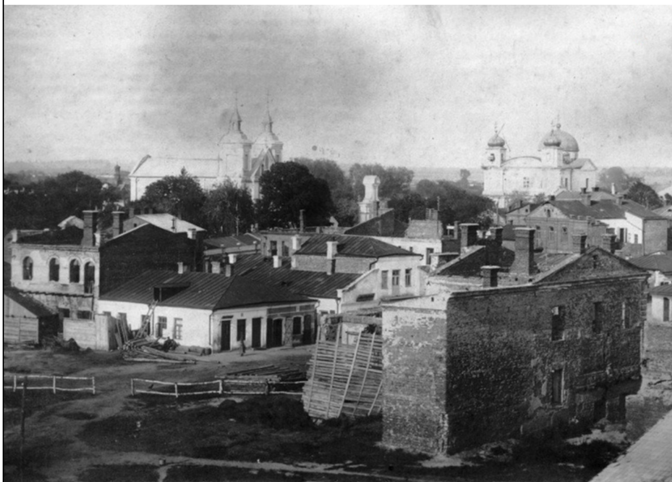
10. Володимир-Волинський. Загальний вигляд із західного боку 1915-1917 рр.