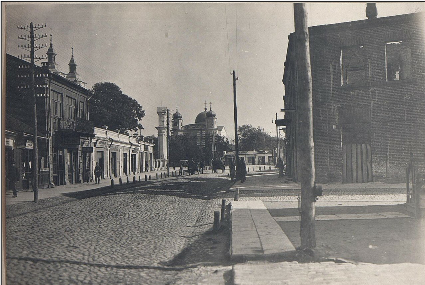
7. Вигляд на Собор Різдва Христового, 1917-1918 рр.