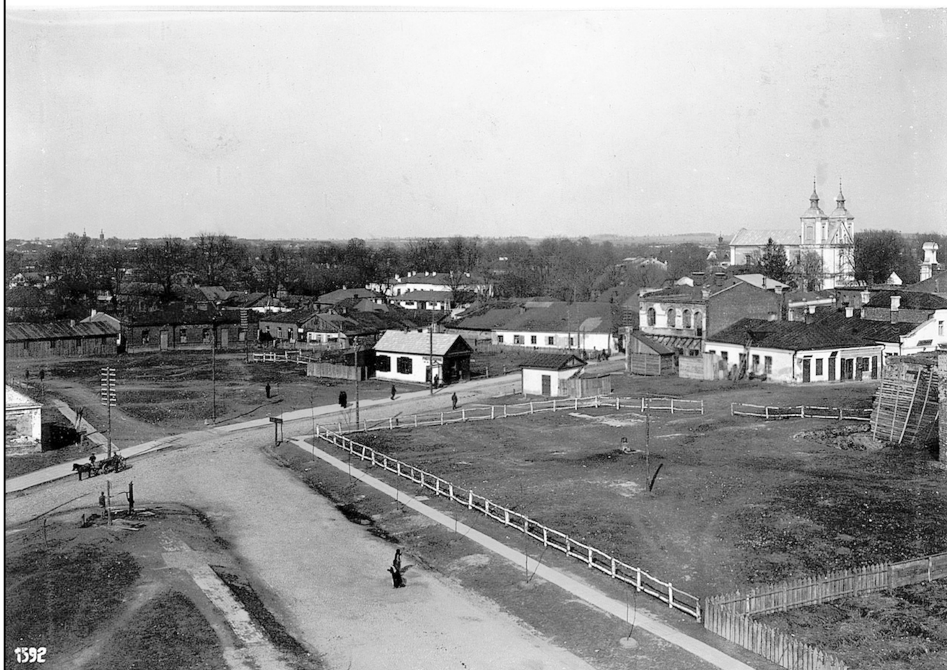
4. Панорама міста, 1918 р. Вигляд із західного боку