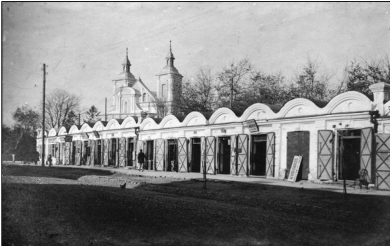
5. Костел Іоакима і Анни. Вигляд з північно-східного боку