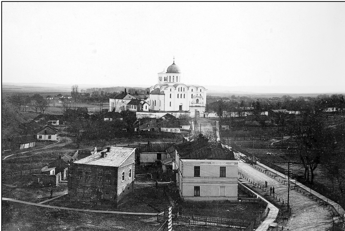
3. Панорама міста, 1918 р. Вигляд з північного боку на комплекс Успенського собору, (теп.вул.Соборна)